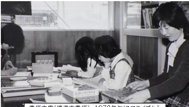
麦垣文庫(境港市麦垣) 1972年クリスマスイブから 48年間の歩み

＜概要＞鳥取県民・市民の半世紀にわたる地域の図書館づくりと地方出版文化顕彰活動による知の地域づくりの歩みは、今。