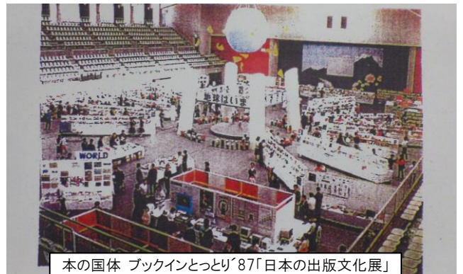
本の国体 ブックインとっとり'87「日本の出版文化展」 米子会場 (1987年10月31日～11月3日)