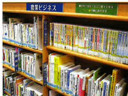
農業ビジネス関連本