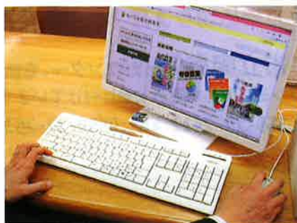
「ルーラル電子図書館」