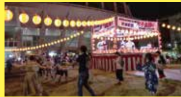
担当:米子市立山陰歴史館・米子市公会堂 協力:米子盆踊り保存会

鳥取県指定無形民俗文化財 米子盆踊り 会場 多目的広場 ステージ 時間 11:00~11:30 出演 米子盆踊り保存会