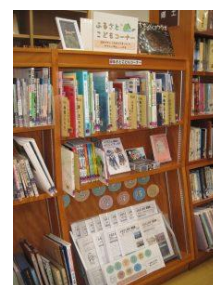
2階「ふるさとこどもコーナー」→

また、2階の郷土資料室にも「ふるさとこどもコーナー」がございます。こちらは、調べ物に役立つ資料を数多く揃えています。閲覧のみとなりますが、調べ学習等にご活用ください。