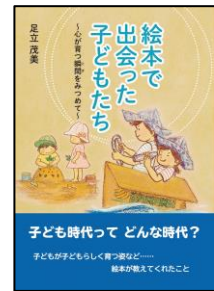
「絵本で出会った子どもたち」