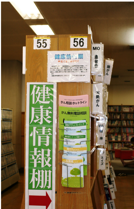
【ふれあいコーナー奥】

米子市立図書館では、平成19年3月に、「健康情報棚」を設置しました。このコーナー設置の目的は、図書館利用の皆さまに、わかりやすい形で健康・医療情報を提供しようとするためです。この書架には、病気に関する入門書・治療ガイド的な本と、患者さんや家族の方の書かれた「闘病記」も一緒に並べてあります。